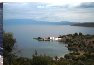
Ausflug nach Trikeri