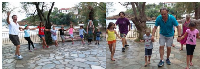
Die Seminar-Teilnehmer tanzen zusammen mit den Dorfkindern vor der Kirche