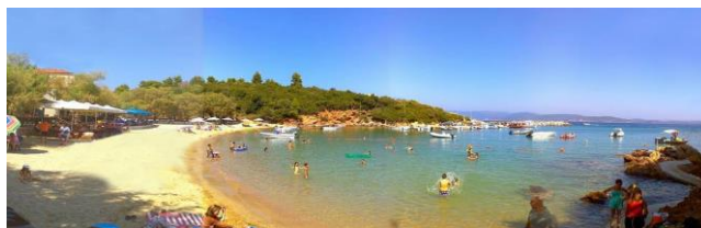
Der erste Strand von Katigiorgis