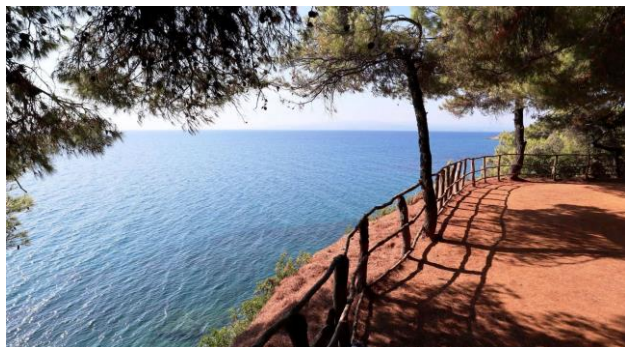
Blick vom Tanzplatz aufs Meer

Das Leben ist Rhythmus, Rhythmus ist Atmung, Atmung ist Bewegung, Bewegung ist Rhythmus, Rhythmus ist Tanz, Tanz ist Leben! J. Dimas