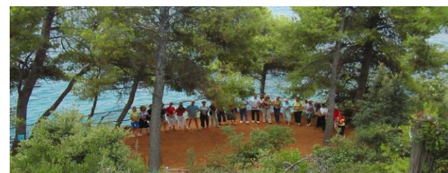
Unser Tanzplatz im Pinienwald im Hintergrund das Meer