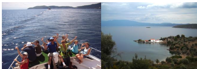
Ausflug zur Insel Skiathos