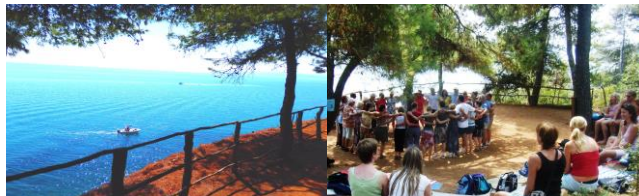
Tanzplatz im Pinienwald mit Meerblick