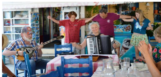
Gute Stimmung bei den Seminarteilnehmern... mit Musik, Gesang und Tanz