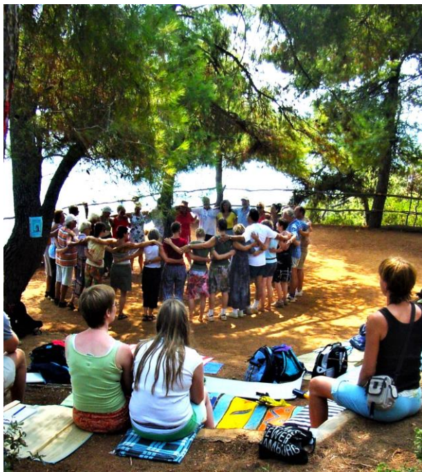
Unser schattiger Waldtanzplatz oberhalb des Meeres in Katigiorgis