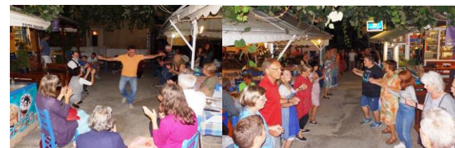
In Katigiorgis tanzen in der Taverne 'Areti' mit den Dorfbewohnern