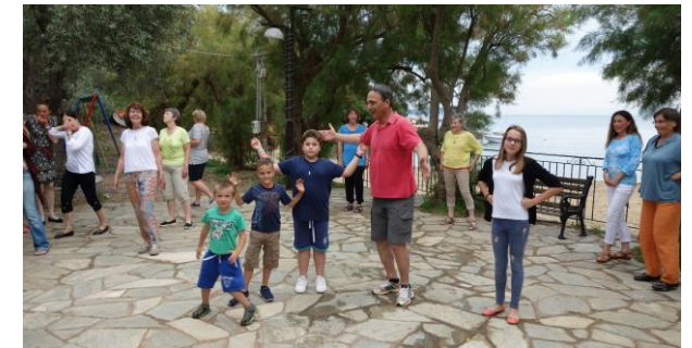
2. Tanzplatz: Die Seminar-Teilnehmer tanzen zusammen mit den Dorfkindern von Katigiorgis, im Hintergrund das Meer