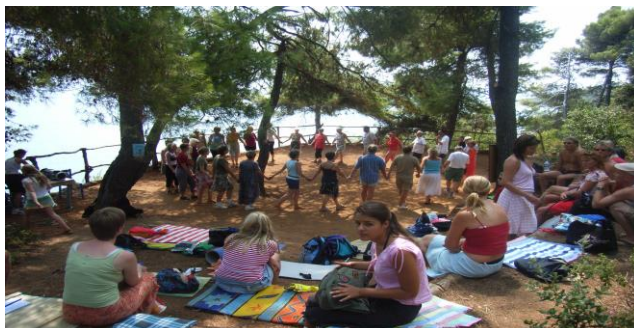
Unser Tanzplatz: hier schenkt uns das Tanzen Freude und Energie