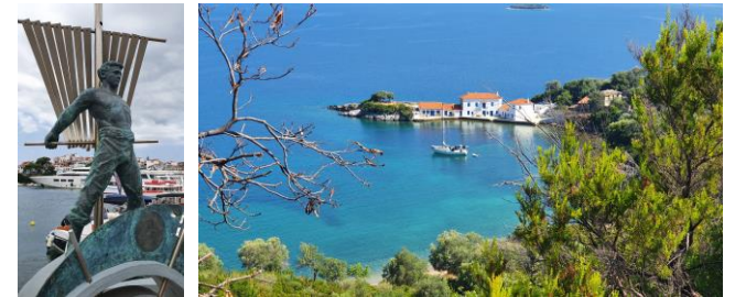
Ausflug zur Insel Skiathos