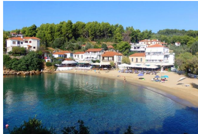
Katigiorgis, ein kleines Paradies

Essen werden wir bei Stamos. Er wird uns mit typisch griechischer Küche verwöhnen. Die Zutaten dafür kommen ganz frisch aus der aller nächsten Umgebung.