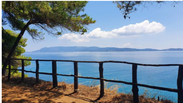
Blick vom Tanzplatz auf's Meer

Unter allen Völkerschaften haben die Griechen den Traum des Lebens am schönsten geträumt. Goethe