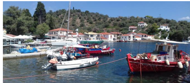
Agia Kyriaki, Trikeri