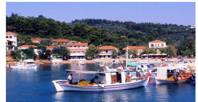
Die malerischen Fischerboote in Katigiorgis