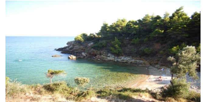
Der zweite zauberhafte Strand von Katigiorgis, Vlachorema Strand