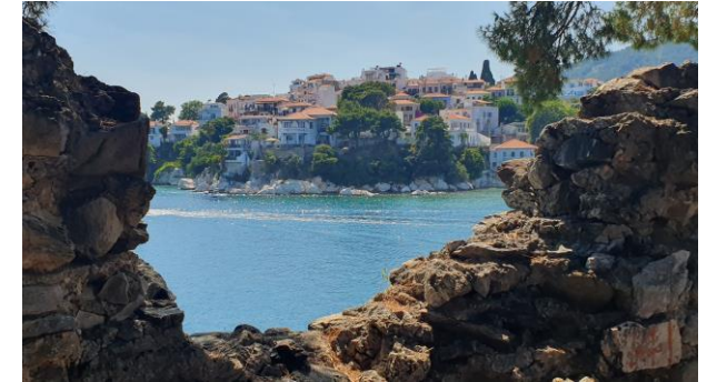
Ausflug zur Insel Skiathos