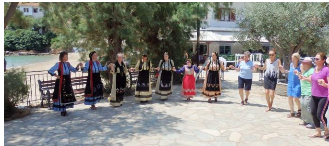
Wir tanzen vor der Dorfkirche, im Hintergrund das Meer