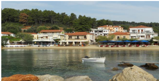
Das Dorf Katigiorgis