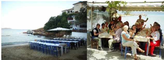
Gemeinsames Essen und "Jia mas", Prost!!