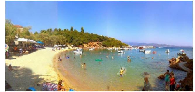
Der schöne Strand von Katigiorgis wartet auf uns