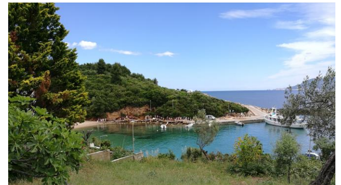
Der kleine Hafen von Katigiorgis: Unsere Gruppe kommt vom Ausflug zurück