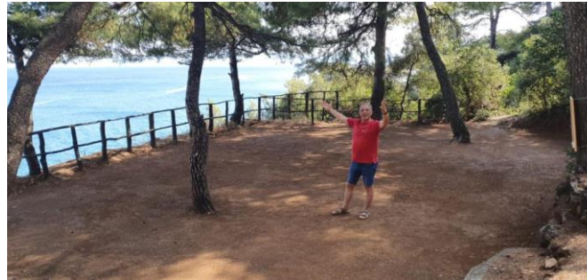
Unser Tanzplatz im Pinienwald oberhalb des Meeres